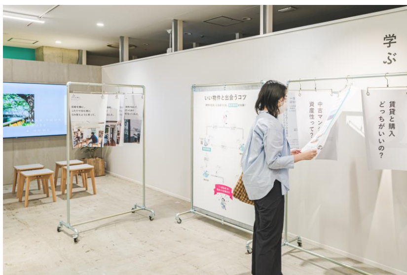
中古物件の選び方や事例、パッケージリノベーションの展示などで学びを深める

土曜・日曜には定期的にセミナーを開催し、物件選びやリノベーションの選択肢について具体的にお伝えします。また、ショップから徒歩約6分のカウカモショールームも見学（要事前予約）できます。ショールームでは、実際のリノベーション物件の中に身を置き、建材に触れたり、VRを使って豊富な選択肢を確認したりすることで、具体的なイメージを膨らませることができます。