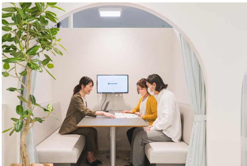
プライバシーに配慮された空間で個別の相談ができる

物件探しの前の条件整理、物件提案、リノベーション、資金計画、持ち家の売却など具体的な個別相談（要事前予約）ができます。