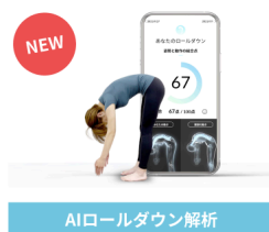
AIロールダウン解析