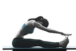
AIロールアップ解析