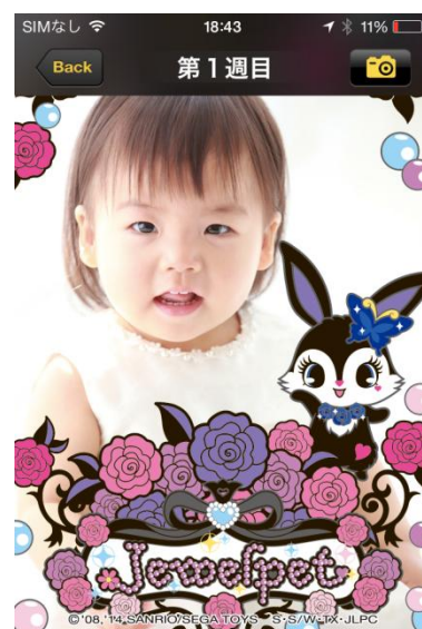
<キャラクターフレームの撮影写真イメージ>