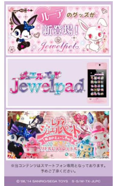
＜キャンペーンサイトイメージ＞