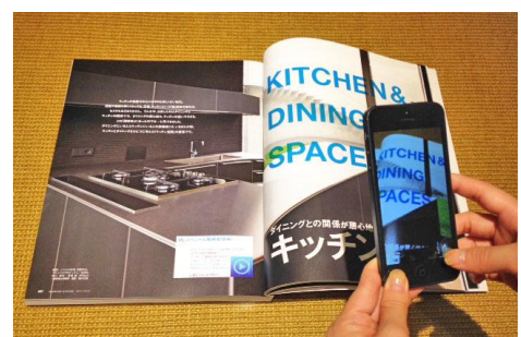
<スキャンイメージ>

※メニューで「カタログ」をタップすると、建築家 5 組分の動画のサムネイルが表示されます。見たい動画のサムネイルをタップすると、自動的に再生されます。