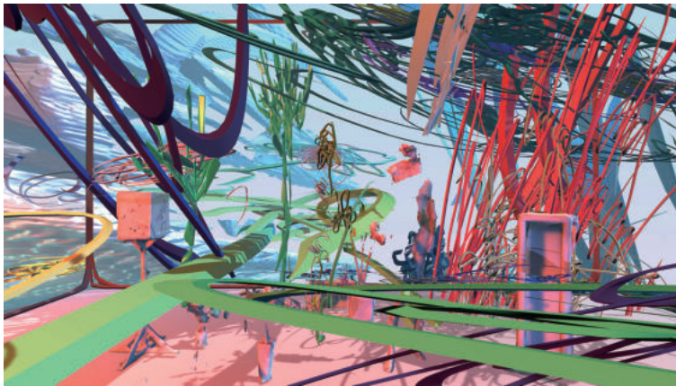
松田 ハル | Hal Matsuda

Unnamed 76.9 × 61.4 × 3 cm (framed) UV inkjet print (StareReap 2.5 print) on acrylic board, polycarbonate