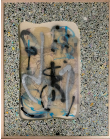
東城 信之介 | Shinnosuke Tojo

Unnamed 76.9 × 61.4 × 3 cm (framed) UV inkjet print (StareReap 2.5 print) on acrylic board, polycarbonate