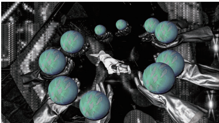
リュウ・イカ | Ryu Ika

Data / 不完全の複製 / Data / Incomplete print 112.4 × 200 cm (image) UV inkjet print (StareReap 2.5 print) on aluminum board