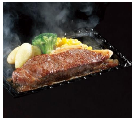
<和牛サーロインステーキ150>