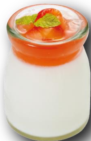
杏仁豆腐(アセロラジュレ)