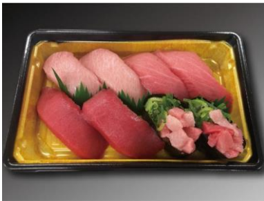
国産本まぐろづくし