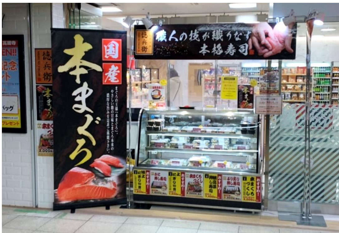
※店舗外観イメージ