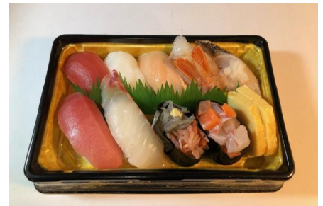
季節の上のにぎり9貫