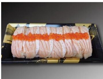
炙りとろサーモン 押し寿司