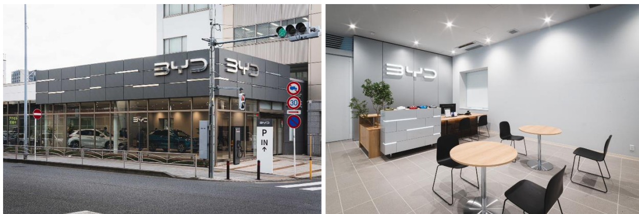
画像は2月2日(木)オープン予定の「BYD AUTO 東名横浜」

販売ネットワークの準備状況は、【参考資料：BYD 正規ディーラーリスト（2023年1月31日時点）】 をご参照ください。