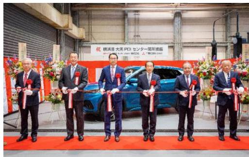
<PDIセンター開所式の様子>

こうした中、BYD Auto Japan が有するEVのラインナップと、三菱倉庫が有する自動車関連物流の拠点やノウハウを活かし、日本のお客様のニーズに応える高品質かつ安定的なEVの供給体制を構築するべく、両社は業務委託契約を締結することといたしました。三菱倉庫は、車両の入港から整備、国内輸送、アフターパーツの保管・全国配送までの物流業務を受託いたします。