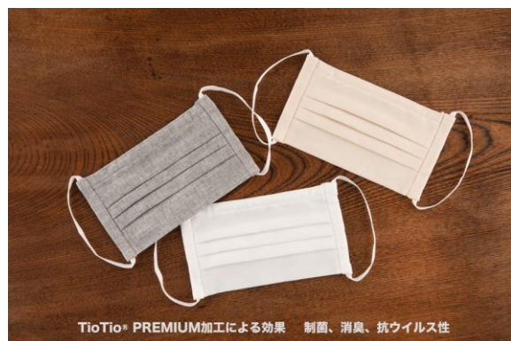
TioTio® PREMIUM加工による効果 制菌、消臭、抗ウイルス性

お客さまから、よりフィット感を求める要望をいただき、SサイズとLサイズをつくりました。Sサイズは小顔の方や小中学生向けの小さめサイズ、Lサイズは男性も使いやすいやや大きめのサイズです。色は従来の「ホワイト」と「杳グレー」に加えて、 Cotton の自然そのままの色で肌や服の色にもなじみやすい「きなり」が加わりました。