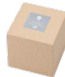
クラフト紙の貼り箱入り

浮玉をアップサイクルしたグラスウェアシリーズ“津軽びいどろ DOUBLE F -UKIDAMA EDITION-”にお酒を楽しむ寛ぎのひとつをシックに彩るグラスウェアアイテムが追加となりました。深みのある青緑色や気泡は、かつて海に浮かんでいた浮玉そのものの表情です。青森の海に想いを馳せ、趣のある風合いをお楽しみください。