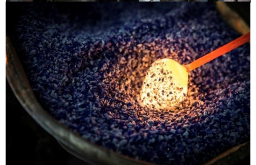
北洋硝子のガラス職人が、ひとつひとつ手作りしています。