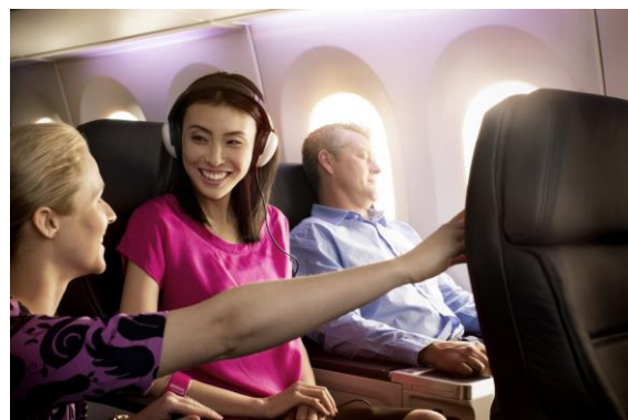
シートから料理まで、エコノミーよりワンランク上の 旅をお楽しみいただける、プレミアム・エコノミー