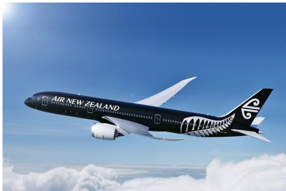
黒の塗装が施された B787-9 型機

詳細はこちらをご覧ください。 http://v6.advg.jp/adpv6/r/tW_4BEK