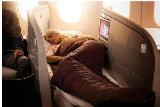
フルフラット・ベッドとしてお休みいただける ビジネス・プレミアの座席