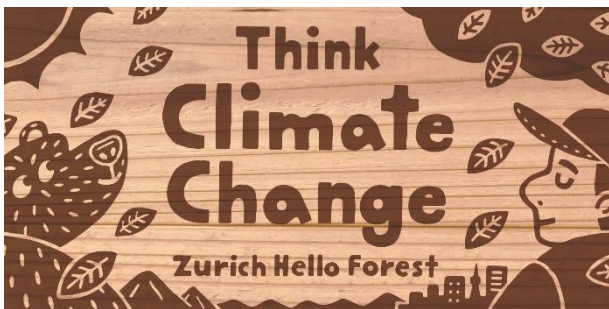
国産間伐材を使用したオリジナルステッカー見本 (表面)

「チューリッヒ ハローフォレスト」は、キャンプを楽しむ方々が、キャンプ場で国産間伐材を使用したオリジナルステッカーを1枚300円で購入することにより、キャンプ1泊1人当たりが排出するCO2をオフセットできるものです。また、当社もお客さまのオフセット金額と同額を国内の森林保全活動へ寄付します。11月5日より、国内8カ所のキャンプ場でこのステッカーを数量限定販売します。気候変動に取り組む当社が、キャンパーの皆さまが気候変動について考え、共に行動するきっかけづくりとしてご提供します。