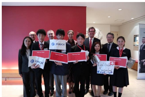
3月22日に開催された壮行会の様子 プログラムに参加する子どもたちとジャン＝フランソワ・パロ 駐日スイス大使

“東日本大震災被災児童の自立支援”“復興の担い手づくり”を目的に発足。主たる活動は、世界10か国の大使館や外務省と連携し実施している「海外ホームステイを通じた被災時の自立心育成活動」。これまでに海外に渡った子ども達は415名を数える(2019年3月25日現在)。「世界」「歴史」「多くの人々の温もり」に触れ帰国した子ども達は、「次は自分たちが誰かの為に」と、恩送りプロジェクト「HABATAKI」を始動。このように、ひとりでも多くの子ども達が自らの力で明るい未来を切り拓いてゆけるよう、同会では継続的な支援活動を行っている。