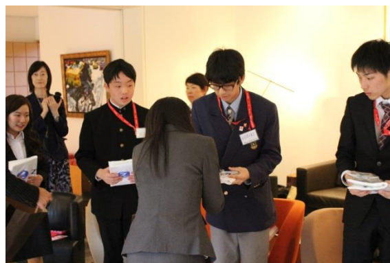
プログラムに参加する子どもたちへ記念品の贈呈