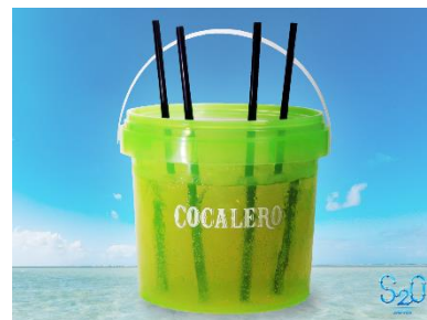
S2Oオリジナル コカレロ パンチボール