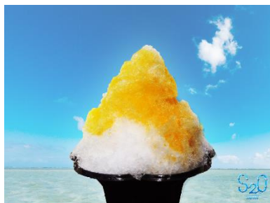
S2O特製かき氷 (マンゴーシロップ・練乳)