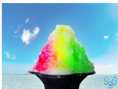
S2O×WANIMA特製かき氷 (ストロベリー・レモン・メロン)