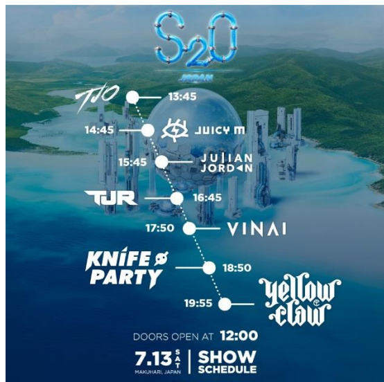
タイムテーブル(7月13日)

いよいよ開催目前となった、2019年7月13日(土)～15日(月・祝)、県立幕張海浜公園にて開催する、“世界一ずぶ濡れになる音楽フェス”、「S2O JAPAN SONGKRAN MUSIC FESTIVAL 2019(エスツーオー・ジャパン・ソングラン・ミュージック・フェスティバル / 以下「S2O JAPAN 2019」)」の、DAY1、DAY2タイムテーブルを発表します。