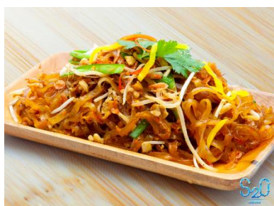
パッタイ(タイ風焼きそば)