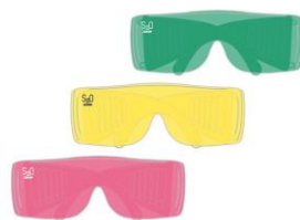
クリアゴーグル PRICE:1000円(税込)