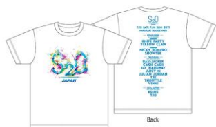
S2O 2019 TOUR TEE PRICE:4500円(税込)