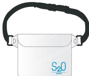
防水クリアポーチ PRICE:2000円(税込)