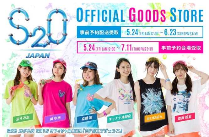
オフィシャル応援団「MFGエンジェルス」グッズ着用イメージ

迫力ある巨大なスクリーンが特徴のステージは、今年4月にタイ本国で開催されたS20 Festival 2019のセットをS20 JAPAN用にカスタマイズ。来場者をずぶ濡れにするウォーターマシーンも、本国のS20 Festivalで水かけ用に特別開発された最新マシーンが日本に上陸し、音楽に身を委ねながらずぶ濡れになる楽しさを思う存分体感していただけます。ステージ脇の海沿いにはステージとメインフロアを上から見渡すことができるVIPエリアを設置。また、会場内にはバラエティ豊かなフード/ドリンクブース、スポンサーブース、ボディペイント、フォトスポットなど、ステージ以外でも楽しめるコンテンツが盛りだくさんです。ヘアスタイリングやマッサージ等、無料で体験いただけるブースもご用意しております。