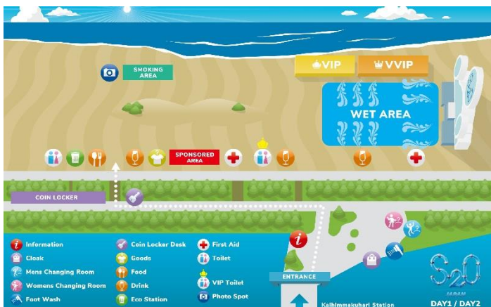
会場エリアマップ(7月13日、14日)

2019年7月13日(土)～15日(月・祝)、県立幕張海浜公園にて開催する、“世界一ずぶ濡れになる音楽フェス”、「S20 JAPAN SONGKRAN MUSIC FESTIVAL 2019(エスツーオー・ジャパン・ソングクラン・ミュージック・フェスティバル / 以下「S20 JAPAN 2019」)の会場エリアマップを公開します。