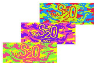
フェイスタオル PRICE:1500円(税込)