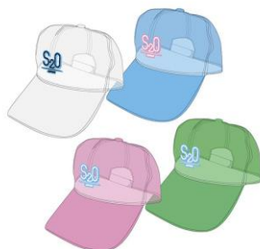
クリアキャップ PRICE:3000円(税込)