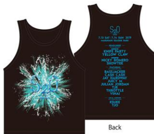
S2O JAPAN 2019 LINEUP TANKTOP PRICE:4000円(税込)