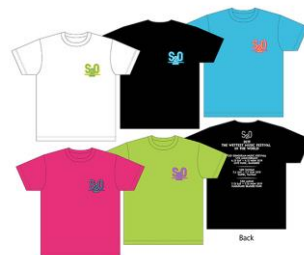
S2O 2019 TOUR TEE PRICE:3500円(税込)