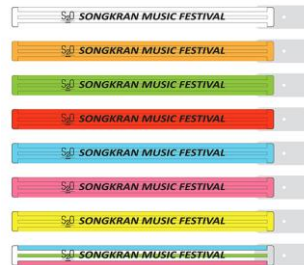
ライトブレスレット PRICE:500円(税込)