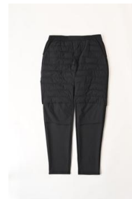
ハイブリッドインサレーションロングパンツ (メンズ) 5,999 円 (税込)