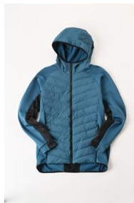
ハイブリッドインサレーションジャケット (メンズ) 6,999 円 (税込)