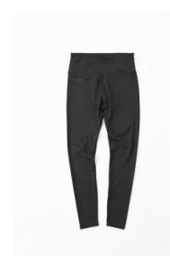
ランニングロングタイツ (レディース) 1,999 円 (税込)