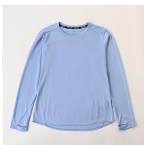
ランニング UPF50+長袖 T シャツ (レディース) 2,499 円 (税込)