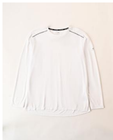
ランニング UPF50+長袖 T シャツ (メンズ) 2,499 円 (税込)