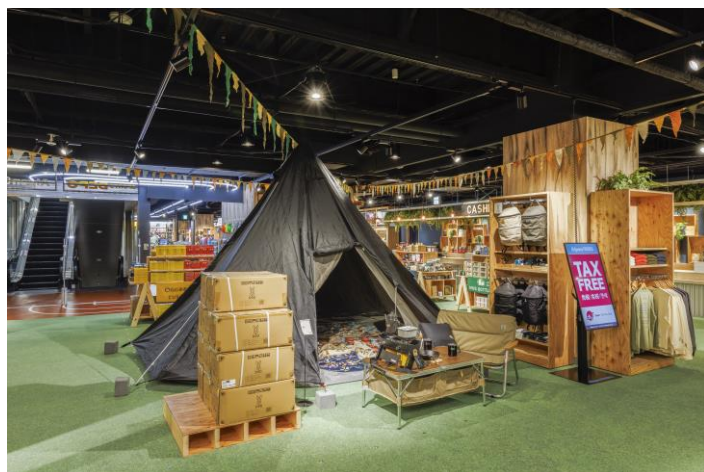
※他店舗のイメージ画像です