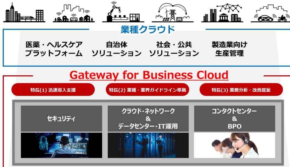
図 マルチクラウドソリューション Gateway for Business Cloud の概要

マルチクラウド環境におけるデジタルイゼーション、モダナイゼーションを支援するマネージドサービス事業を強化