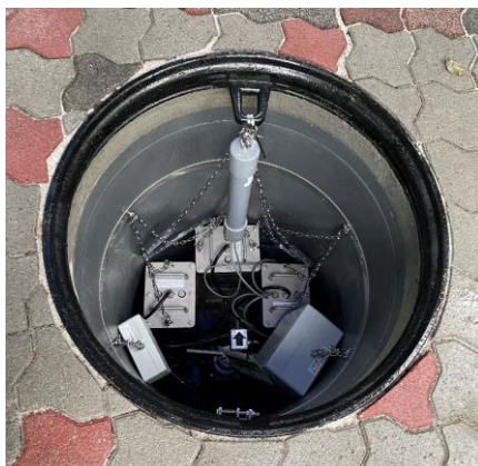
流量計室（内径 600mm）に設置した流量監視装置