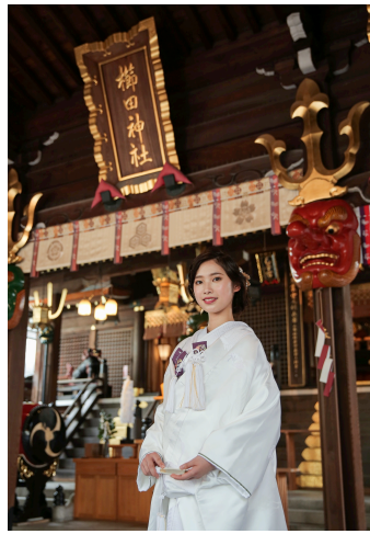
衣裳名：祝飛翔鶴银杏（いわいひしょうつるぎなん） レンタル価格：¥250,000（税抜）

TAKAMI BRIDALとご縁がある2社と、今回初めてのコラボレーションが実現しました。白無垢には、神社内の霊前鶴を思わせるような不老長寿を表す鶴の柄と、櫛田神社のご神木である、银杏の柄を配しております。白無垢の内側の1カ所には、たくさんの実をつけることから夫婦円満を表すといわれる银杏の刺繍を施し、外側から見えない細部までもこだわりました。櫛田神社で挙式をされ、披露宴をホテルオークラ福岡で開かれるお客様には、白無垢のふきの浅緑と银杏の黄色に、小物で紫を加えたホテルオークラ福岡のロゴカラー3色でのコーディネートもおすすです。