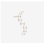
Clea (シングルピアス) ¥96,800 K18YG・あこやパール

〈concept〉「甘すぎなくて強い、そして時代を超えて美しい」をコンセプトとする デザイナー・奥田麻弥子氏のディレクションによる日常使いもできるジュエリーコレクション。