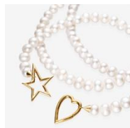
Rosia (ネックレス) ¥121,000 SV 925+K18メッキ・108cm