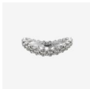
Diamond Pave Full Eternity Ring pinky ring ¥418,000~ / ring ¥506,000~ K18WG/YG・ホワイトダイヤ

〈concept〉「永遠の花」をテーマに、美容家・石井美保氏がプロデュースする優美なジュエリーコレクション。 洗練と上品さを備えたジュエリーで時代を超えて魅了する輝きをあなたに。