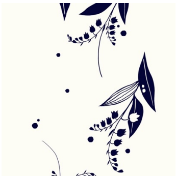
すずらん柄 (ホワイト)