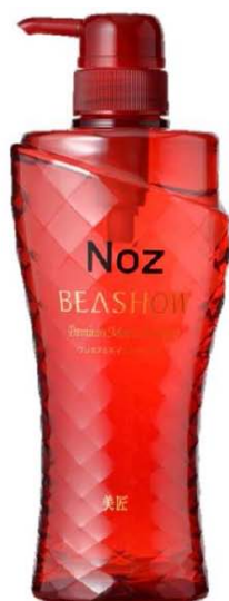
プレミアムモイストシャンプー <ノンシリコンシャンプー> 500ml 945円(税込)