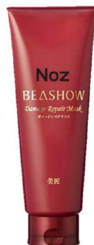
ダメージリペアマスク 220g 1,260円(税込)

うるおいを保つセラミドに着目して開発されたセラキュート®が毛髪表面に働きかけ、ダメージにより質感(ボリューム感)の低下を改善。