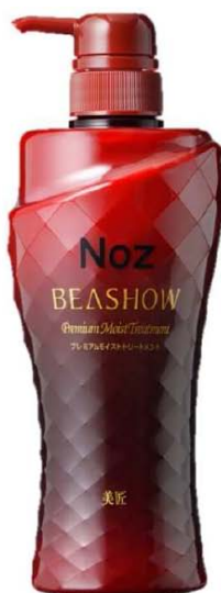
プレミアムモイストトリートメント 500ml 945円(税込)

きめ細かい泡がシャンプー時の摩擦から髪を守り、高機能ヒアルロン酸が髪に潤いを与え、4種類の天然由来成分でしっかり地肌ケア 1本で地肌から毛先まで潤う髪へ。