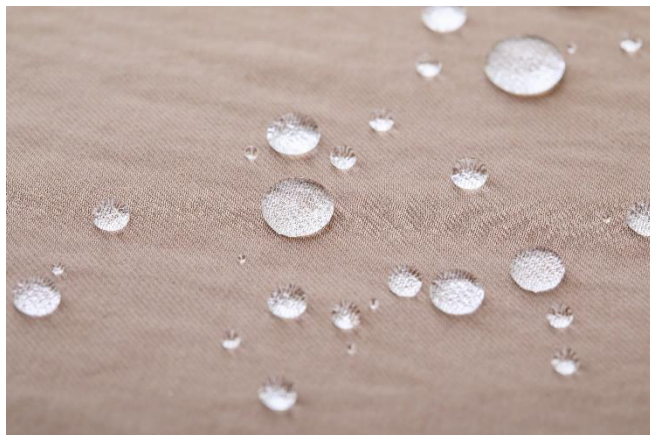
Nano-Tex®加工繊維採用、しっかり撥水します。

防汚性、撥水・撥油性だけでなく、通気性をそこなわれない、高機能なNano-Tex®加工繊維を採用の「防汚撥水シリーズ」。日常で敬遠しがちなホワイトシャツも汚れがつきにくく、色付きの飲み物をこぼしても、しっかり弾いてくれます。また、ウォッシュブル対応でお手入れも簡単のため、毎日着回したくなる商品です。