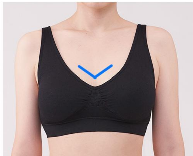
デコルテをすっきり見せるVカット

スポーティーになりすぎないように、襟ぐりのカットを深めにするなどカットラインにこだわることで大人っぽく上品な印象に。また、ホックのないニットタイプなので被るだけで簡単に着用いただけます。