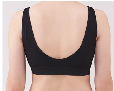
背中スッキリ ホックボタン無し