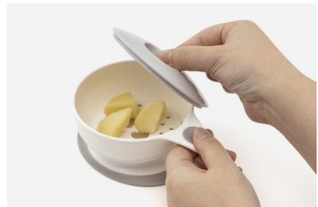
<電子レンジで蒸す>

「離乳食調理器9点セット」は、子育て世代が悩みがちな離乳食期に嬉しいアイテムがそろったセットです。「すりつぶす・おろす・うらごし・電子レンジで蒸す」という離乳食づくりに必要な4つの基本調理ができます。通常の調理器具では量の調整が難しかったり、洗い物が大変という“子育てあるある”な悩みを解決する、コンパクトサイズながら頼れるアイテムです。調理器具のセレクトは自社でしており、多くの子育て家庭から望まれていた、食材を細かくするのに欠かせない「すりこぎ」もついています。また、ベビーアイテムでありながらKEYUCAならではの暮らしになじむホワイト&グレーのニュアンスカラーもポイントです。