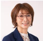
益子 直美さん バレーボール 元日本代表