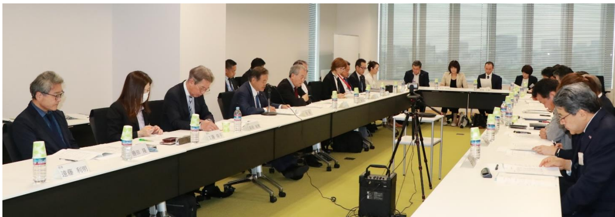
<臨時理事会の様子>

当協会は、今後とも、スポーツを愛するすべてのみなさまと“ともに”、「スポーツと、望む未来へ。」の実現を目指してまいります。