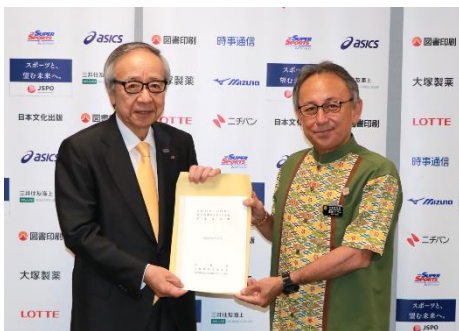
(左から)伊藤会長(JSPO)、玉城知事(沖縄県)

日 時 : 令和 5(2023)年 5 月 25 日(木) 14 時 30 分~14 時 45 分 提出者 沖縄県知事 玉城 デニー 沖縄県教育委員会教育長 半嶺 満 沖縄県スポーツ協会理事長 渡嘉敷 通之 対応者 日本スポーツ協会会長 伊藤 雅俊 日本スポーツ協会常務理事/ 国民スポーツ大会委員会委員長 大野 敬三 日本スポーツ協会常務理事 岡 達生