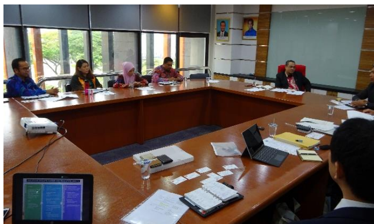
<マレーシアとの 2017 年の交流の様子>

スポーツを「する」「みる」「ささえる」ための環境づくりを行う JSPO(正式名称:公益財団法人日本スポーツ協会 東京都新宿区/会長 伊藤雅俊)は、令和 5(2023)年 2 月 17 日(金)~22 日(水)に、マレーシアのスポーツ関係者を招いて、JSPO-ACP やスポーツボランティアを中心としたレクチャーや意見交換を通じた交流を行います。