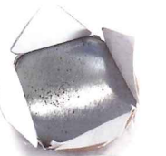
▲「両面ラミネート缶バッジ」 (特許第6546636号)

・異物混入対策・防錆対策へのプラスワン効果が見込まれる特許技術で、高品質な缶バッジを製造。 ・月産100万個生産できる設備を保有。