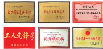
▲開封工場は河南省政府より様々な賞を受賞

・週1回の自社コンテナ便出荷で、OEM生産でも安定納期をご提供。 ・完全オーダーメイドでの縫製品製造ができ、お客様のご相談に専門的に お答えできるスタッフは国内に。 プリント・刺繍他、様々な加工も 幅広く対応いたします。