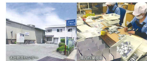
本社物流センター

・商品の荷受けから検品・アッセンブル・保管・出荷まで、サンワでトータルサポート。 ・特殊なアッセンブル、多様なパッケージングも積極的に対応。 ・弊社センター内にも作業場を持ち、機密性の高い案件作業の実績あり。品質管理専門スタッフを筆頭に、細やかに対応いたします。