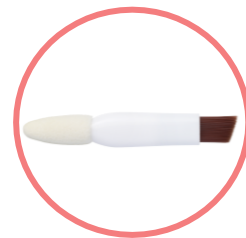
楕円形チップ & 斜めカットブラシ付き

自眉に馴染むやわらかい質感の微粒子パウダーを採用。密着性が高く水をはじきやすいパウダーです。