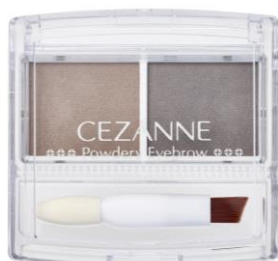
P2: ナチュラルブラウン