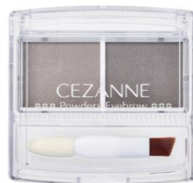
P3: チャコールグレー