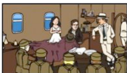
[Herge's Raiders of the Lost Ark]