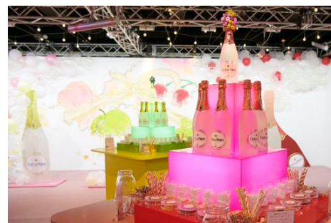
『Café de Paris “My Sparkling Time” Decorated by のん』内観

女優、創作あーちす。1993年兵庫県生まれ。2016年公開の劇場アニメ「この世界の片隅に」で主人公・すずの声を演じ、第38回ヨコハマ映画祭「審査員特別賞」を受賞、高い評価を得る。作品は同映画祭で作品賞、第40回日本アカデミー賞では最優秀アニメーション作品賞を受賞した。2017年に自ら代表を務める新レーベル『KAIWA(RE)CORD』を発足。シングル『スーパーヒーローになりたい』『RUN!!!』とアルバム『スーパーヒーローズ』を発売。2019年6月ミニアルバム「ベビーフェイス」を発売。創作あーちすとしても活動を行い、2018年自身初の展覧会『のん'ひとり展-女の子は牙をむく-』を開催。