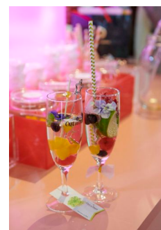
グラスに付けたタグは、 のんさんが描いた フルーツのイラストを 配したデザイン