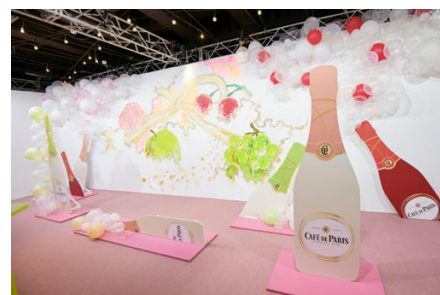
3日間のみ限定公開！ のんさん描き下しのウォールアート