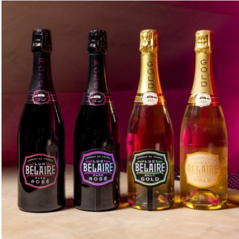
「リュック・ベレール (LUC BELAIRE)」 国内展開アイテム

発売を記念して、「Herbal Chinese STEAMAN」とコラボレーションし、 テントサウナ併設の海の家を9月3日までの期間、江ノ島にオープン！