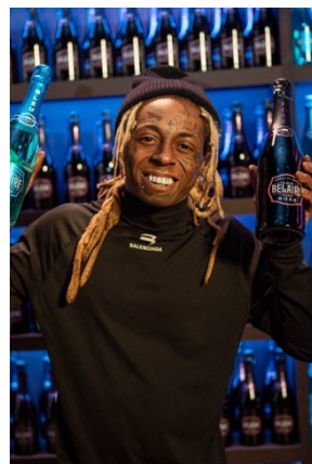
「リュック・ベレール」アンバサダー Lil Wayne