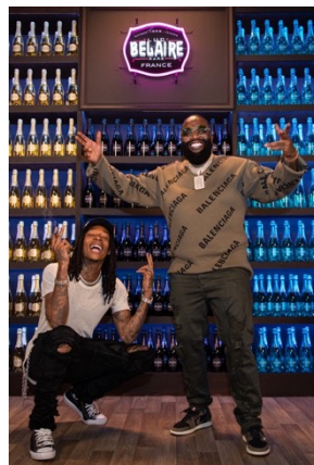
「リュック・ベレール」アンバサダー 左) Wiz Khalifa、右) Rick Ross

「リュック・ベレール」は、ヒップホップラッパーとして世界的に認知されている、リック・ロス(Rick Ross)、リル・ウェイン(Lil Wayne)、ウィズ・カリファ(Wiz Khalifa)、DJ キャレド(DJ Khaled)などの常任のアンバサダーたちにより、急速に世界に広がっています。若い消費者にとってより関連性・親和性のある「自分たちのブランド」として認知され、愛されています。