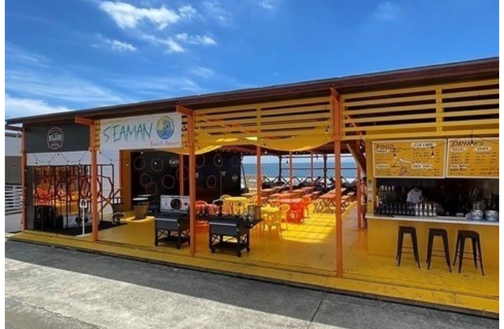
「STEAMAN Beach Resort」外観

ペルノ・リカール・ジャパン株式会社(本社:東京都文京区 代表取締役社長:トレイシー クワン)では、アメリカNo.1 (※1) のプレミアム (※2) スパークリングワイン「リュック・ベレール (LUC BELAIRE)」の日本国内での販売を2023年7月より開始しました。展開は、「リュック・ベレール レア ロゼ」「リュック・ベレール ゴールド」と、ボタンを押すとラベルが鮮やかに光る「リュック・ベレール レア ロゼ ファントム」「リュック・ベレール ゴールド ファントム」の4アイテムです。