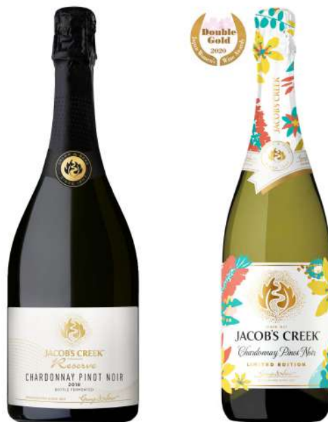
左)ジェイコブス・クリーク リザーヴ シャルドネ ピノ・ノワール 2018 右)ジェイコブス・クリーク シャルドネ ピノ・ノワール 限定デザインボトル

「ジェイコブス・クリーク シャルドネ ピノ・ノワール 限定デザインボトル」 11月2日(月)より数量限定発売！