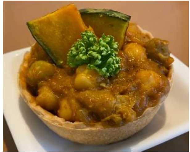
大手前カレー研究会開発「おやつカレー」

「大手前カレー研究会」は、本学の健康栄養学部の有志の学生により、日本人の国民食であり健康食とも言えるカレーをプロデュースすることを目的とし、2016年8月に発足。学園祭での出店や地元企業との産学連携事業としてのオリジナルカレーの制作を行ってきました。コロナ禍で大学の学びがオンライン主体になるなど、学生の実践活動の機会が減少しているため、若い世代に夢を生み出せる場を創出したいという宝塚カレーグランプリ実行委員の想いに共感し、この度、本イベントに参加することとなりました。