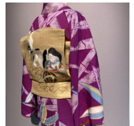
松竹衣裳による着物コーディネート

歌舞伎や舞台演劇、オペラ、ミュージカルなど幅広い分野において登場人物たちを彩ってきた松竹衣裳。本展では、「大正ロマン」をコンセプトにした着物のコーディネートとモダン・ガールの装いが登場します。文化財空間を舞台に、今にも動き出しそうな大正時代の乙女たちをご覧ください。