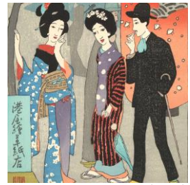
「港屋絵草紙店」復刻木版画（部分）

大正ロマンを代表する画家の一人、竹久夢二。本展では直筆原画を含む約50点の作品を「港屋絵草紙店」「美人画」「童画」「セノオ楽譜」の4つのカテゴリーに分けて展示します。文化財「百段階段」を手掛けた画家たちと竹久夢二の時を超えたコラボレーションをお愉しみください。