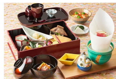
日本料理「渡風亭」 ひな膳(イメージ)

ご予約・お問合せ: Tel:050-3188-7570(レストラン予約) https://www.hotelgajoen-tokyo.com/restaurant/bitotakumi