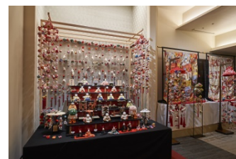
エレベーターホール