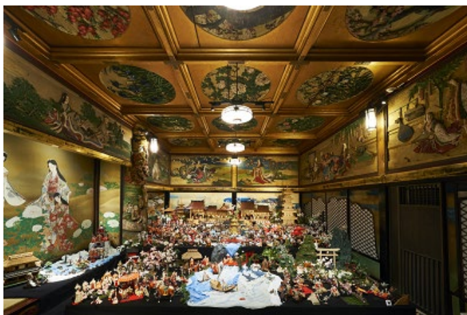
「座敷雛」 / 約700体の雛人形で神話の世界を表現

日本美のミュージアムホテル、ホテル雅叙園東京(所在地:東京都目黒区 / 総支配人:吉澤真一郎)では、2020年1月24日(金)から3月15日(日)まで「百段雛まつり2020 出雲・因幡・萩ひな紀行」を、館内にある東京都指定有形文化財「百段階段」にて開催しています。日本各地の歴史ある雛人形が集結する本展は、過去10回の開催で、延べ61万人を超える来場者数を記録する都内最大級の雛人形展です。第11回目は初の地域となる鳥取・島根・山口の3県より神話や幕末の偉人など、歴史が息づく町々から「百段階段」へお雛さまたちが集いました。約700体の雛人形で情景を表現する圧巻の「座敷雛」展示に加え、令和第一回の開催を記念し、江戸・明治・大正・昭和・平成・令和の各時代を象徴する「時代雛」も展示。さらに現代のインテリアにマッチする桃の節句のテーブルコーディネートをご提案する「雛のしつらい」を同時開催。普段は現地でしか出会うことのできない総数1,000体にもおよぶ珠玉のお雛さまと展示会場である絢爛豪華な文化財とのコラボレーションを是非ご覧ください。