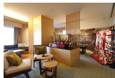
お雛さまコンセプトルーム(イメージ)

ご予約・お問合せ : 03-5434-3837 (フロント) https://www.hotelgajoen-tokyo.com/stay/plan