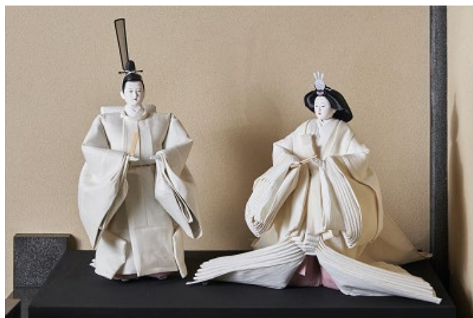
「令和雛」 / 新元号「万葉集」ゆかりの麻を用いたひな人形