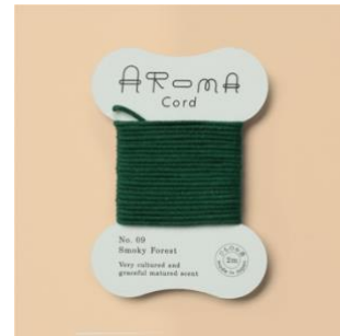
▲ 09. Smoky Forest 燻のきいた大人の雅を感じる香り