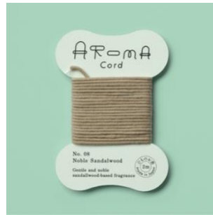
▲ 08. Noble Sandalwood 高貴な白檀を優しく清らかなにした香り