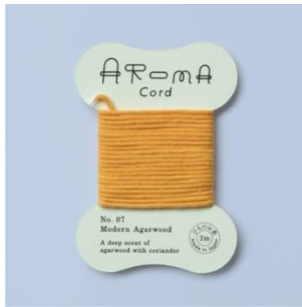
▲ 07. Modern Agarwood 沈香にコリアンダーを加えた深淵な香り