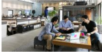
The Gramping 10日前

たまには湖畔のロッジとかで研修したい！ 法人向けグランピングサービス「The Gramping」