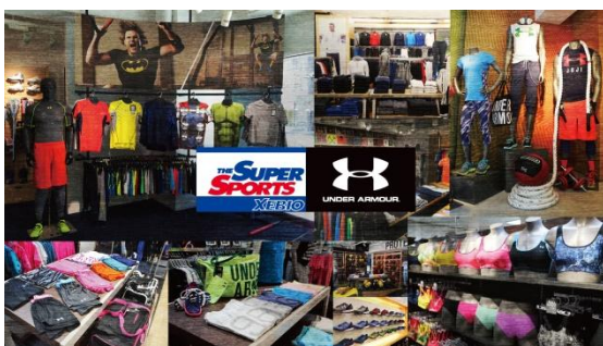
※UNDER ARMOUR イメージ

人気スポーツブランド「UNDER ARMOUR」「NIKE」を中心として、お使いになるシーン別の商品展開を行います。