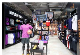
ZONE OF HOOPS+