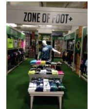
ZONE OF FOOT+