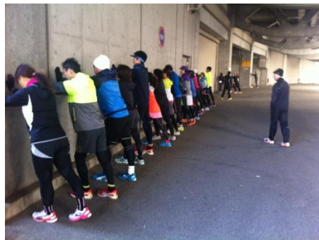
第1回イベントの様子