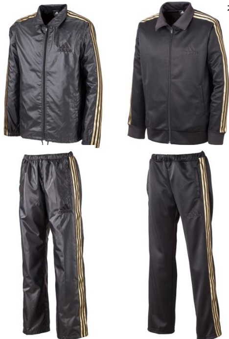
(品番:W59886) ¥7,245 (品番:W59849) ¥7,245