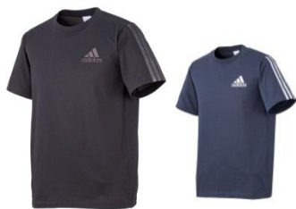
左(品番:W57943) 右(品番:W57941) ¥3,990