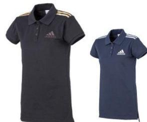
左(品番:W58746) 右(品番:W58740) ¥5,145