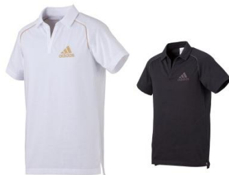
左(品番:W57910) 右(品番:W57919) ¥4,410