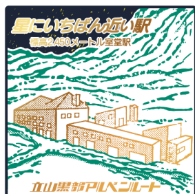
「星にいちばん近い駅」リバイバルスタンプデザイン

期間中、室堂駅と大観峰駅のスタンプを獲得すると、2024年実施のキャンペーン限定デザイン「星にいちばん近い駅」のリバイバルスタンプをプレゼント(自動付与)。