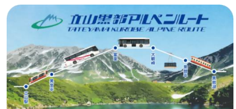
立山黒部アルペンルート スタンプ帳ラベル