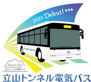
立山トンネル電気バスデビューロゴスタンプ

期間中、室堂駅と大観峰駅のスタンプを獲得すると立山トンネル電気バスデビューロゴスタンプをプレゼント(自動付与)。