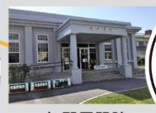
与那原駅跡 与那原町立 軽便与那原駅舎展示資料館

沖縄県鉄道（1914年～1945年） 戦前に沖縄県が沖縄本島内で運営していた鉄道。一般の鉄道よりも狭い線路幅を採用した「軽便鉄道」であったことから、沖縄県民からは「ケービン」という愛称で親しまれていた。人々の生活と経済を支えていたが戦争によって全てが破壊されてしまい、現在はその姿がわずかしか残っていない。