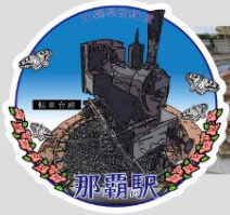
那覇駅跡 那覇バスターミナル交通広場内