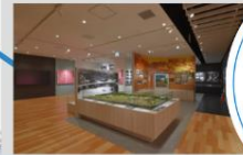
嘉手納駅跡 かでな未来館 嘉手納町歴史民俗資料室