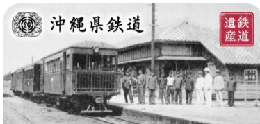
「沖縄県鉄道」スタンプ帳ラベル