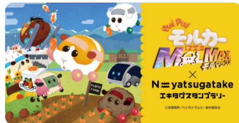
専用スタンプ帳のラベル

② 富士見パノラマリゾートの売店でコンプリートスタンプを提示すると、 限定ポストカード をプレゼント（数量限定）。引換時に NFC タグタッチで引換済みスタンプをプレゼント