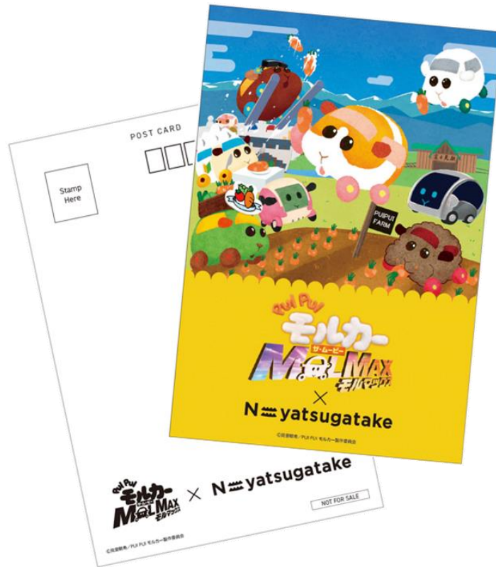
ポストカードのデザイン

左から富士見バナラリゾートの山麓レストラン 山頂フォトスポット周辺でもらえるスタンプ、コンプリート、引換済みスタンプ